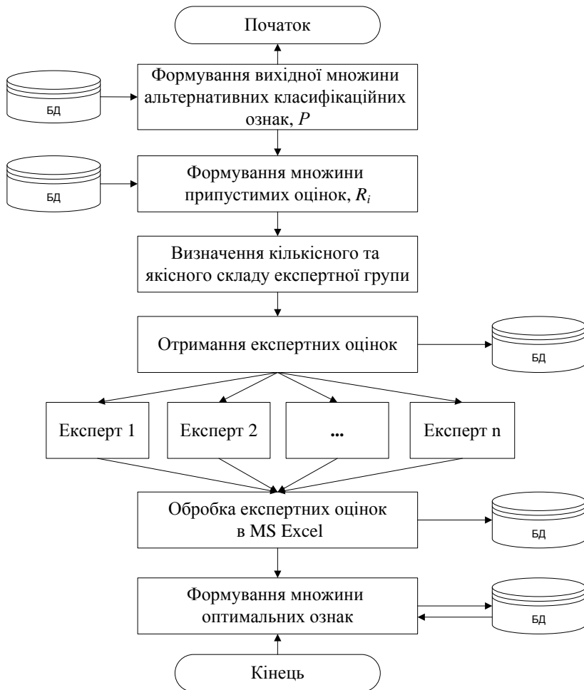
Рисунок 1 – Алгоритм проведення методу ранжування при визначенні класифікаційних ознак витрат на якість процесів ІС ППВ

де m – кількість експертів; S_i – сума рангових оцінок експертів згідно з кожною ознакою класифікації; \bar{S} – середня сума рангів усіх ознак; T_j – показник однаковості.